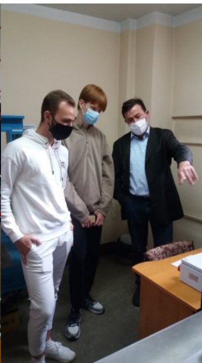
Pracownia Wzorców Dużej Masy