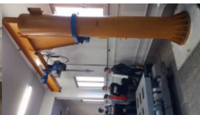
Pracownia Wzorców Dużej Masy